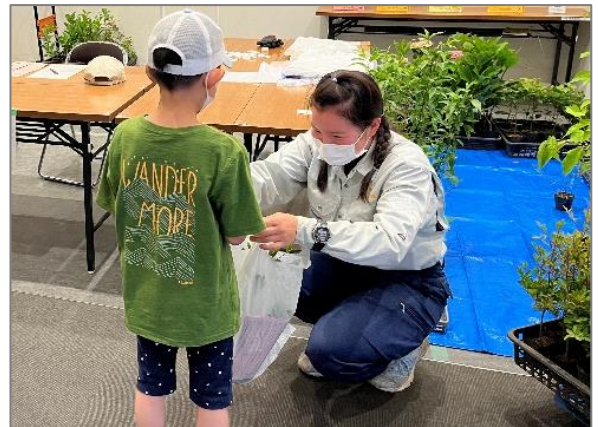
24 人生記念樹の配布 （戸塚区庁舎）