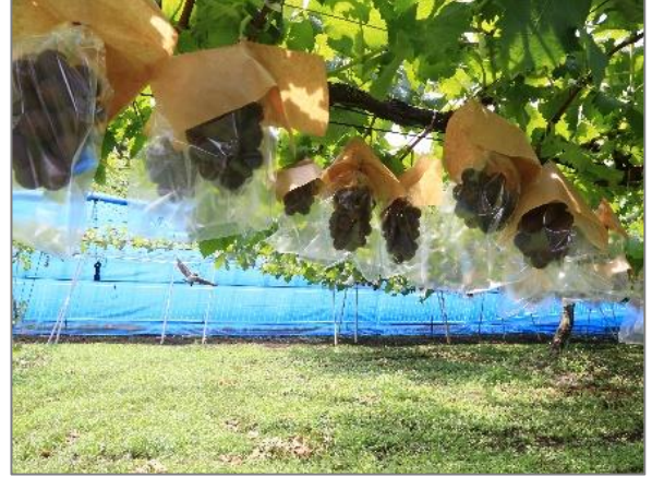
12 収穫体験農園の開設 （平戸町）