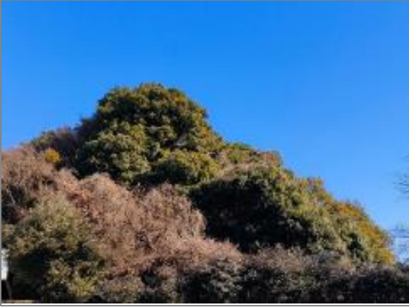
1 緑地保全制度による新規指定 緑地保存地区（上矢部町）