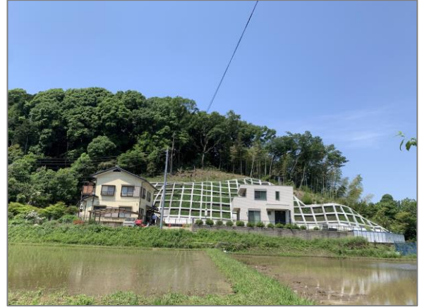
1 保全した樹林地の整備 （舞岡ふるさとの森）