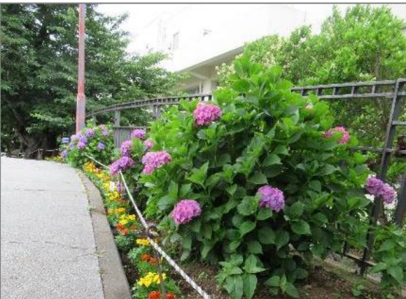
23 緑や花を身近に感じる各区の取組 （柏尾川沿い）