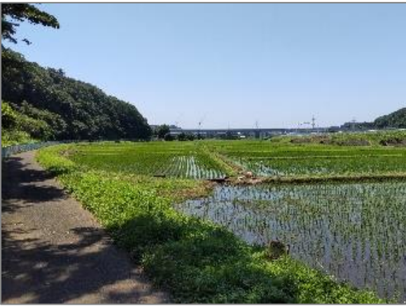
8 水田の保全 （東俣野町）