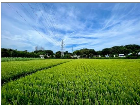
8 水田の保全 （大熊町）