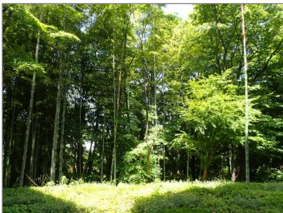
1 緑地保全制度による新規指定 緑地保存地区（茅ヶ崎南一丁目）