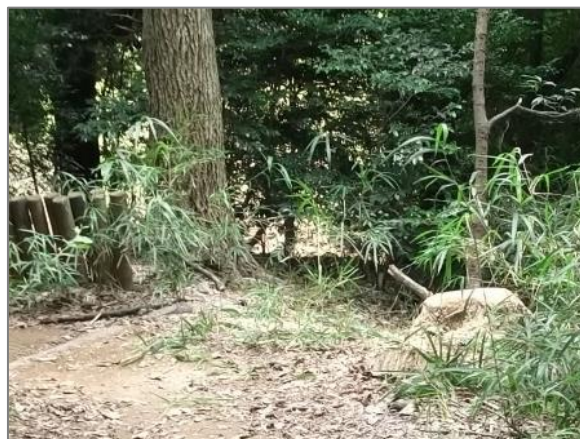
2 森の維持管理 （山田富士公園）