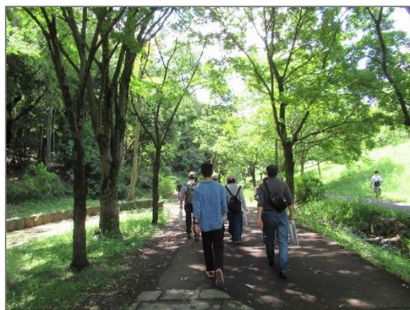
23 緑や花を身近に感じる各区の取組 （くさぶえのみち）