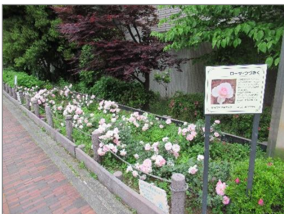
17 公共施設・公有地での緑の創出・育成 （都筑区庁舎）