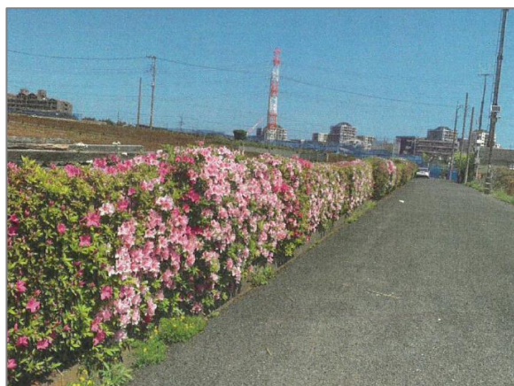
10 農景観を良好に維持する活動 （折本農業専用地区協議会）