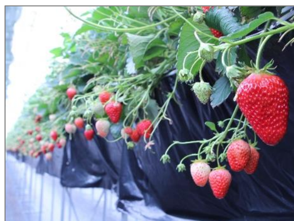
12 収穫体験農園の開設 (鉄町)