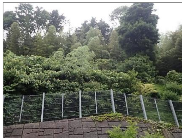
1 緑地保全制度による新規指定 源流の森保存地区(荏田町)