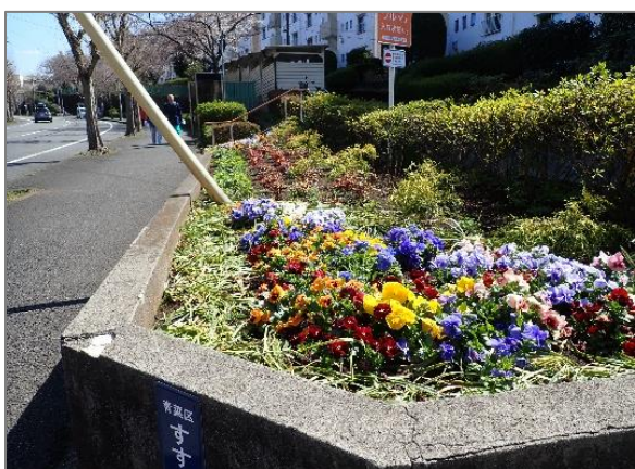
22 地域緑のまちづくり (すすき野三丁目地区)