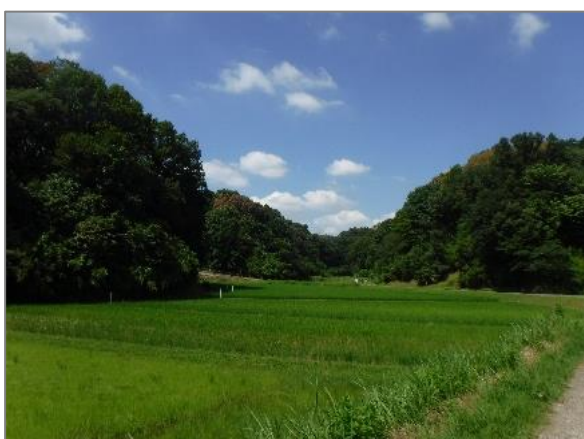
8 水田の保全 (寺家町)