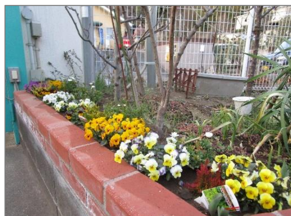
25 保育園での緑の創出・育成 (区内保育園)