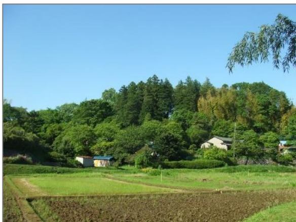
1 緑地保全制度による新規指定 (奈良町西ノ谷特別緑地保全地区)