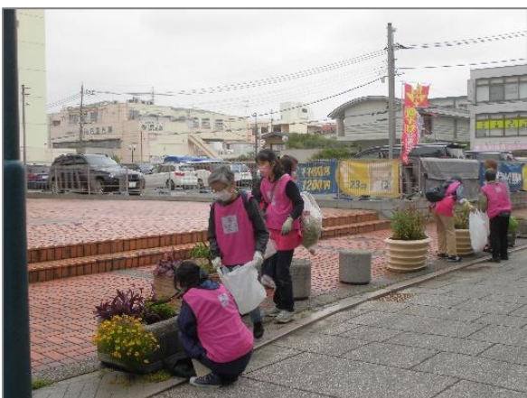
22 地域緑のまちづくり （綱島西地区）