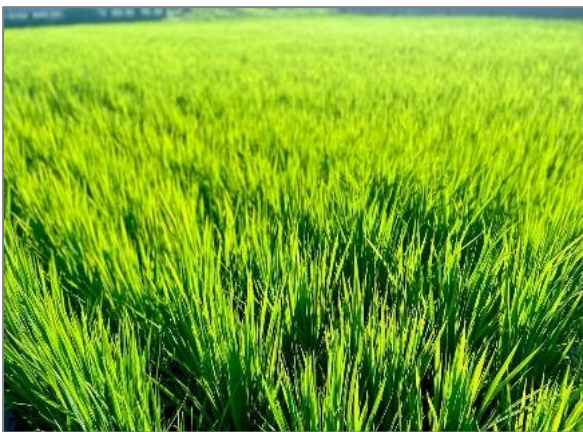
8 水田の保全 （小机町）