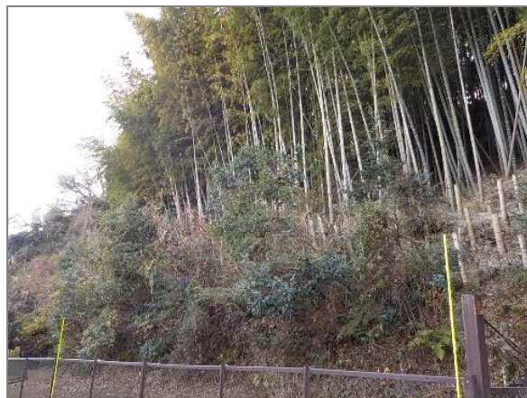
2 森の維持管理 （大曽根台特別緑地保全地区）