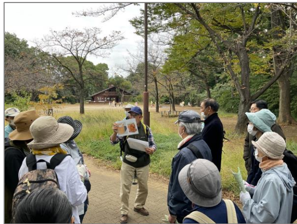
23 緑や花を身近に感じる各区の取組 （綱島公園）