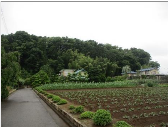
1 緑地保全制度による新規指定 緑地保存地区（綱島台）