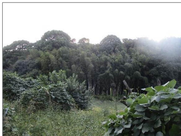
1 緑地保全制度による新規指定 源流の森保存地区（峰町）