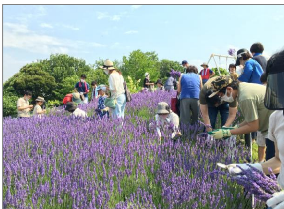
22 地域緑のまちづくり （磯子3丁目地区）