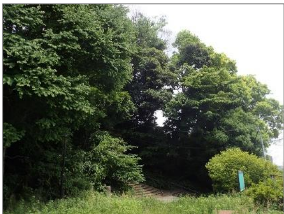
1 緑地保全制度による新規指定 緑地保存地区（森二丁目）