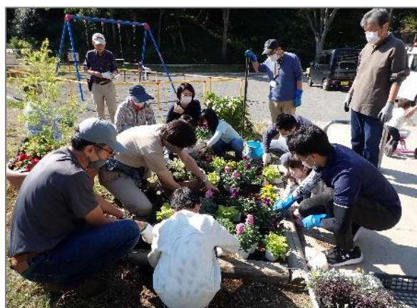
23 地域の花いっぱいにつながる取組 （汐見台二丁目公園）