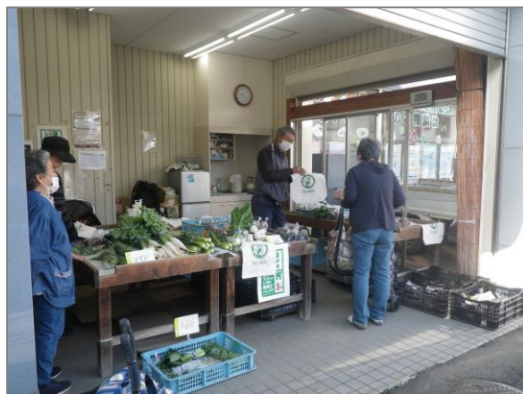
14 青空市・マルシェ等 （杉田野菜直売所）