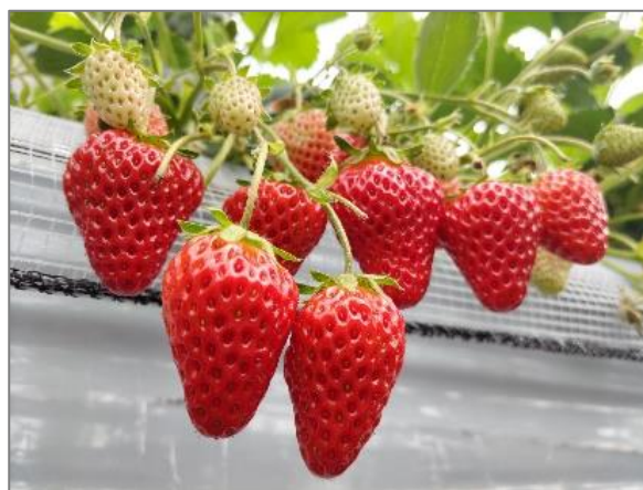
12 収穫体験農園の開設 （今宿一丁目）