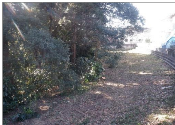
2 森の維持管理 （希望が丘水の森公園）