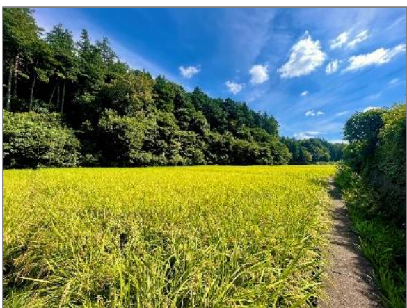
8 水田の保全 （矢指町）