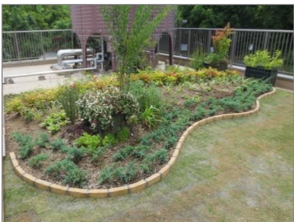
17 公共施設・公有地での緑の創出・育成 （旭図書館）