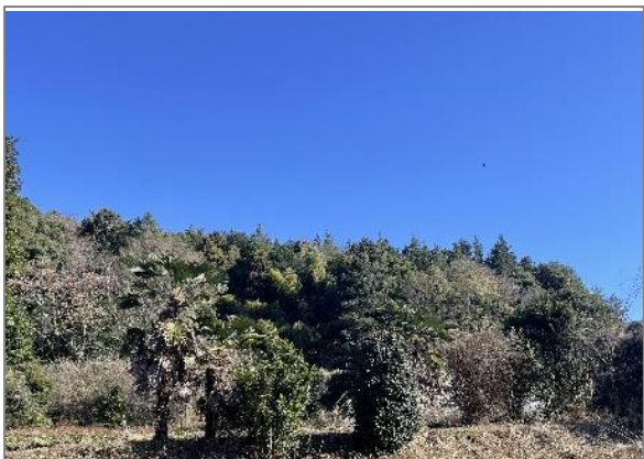
1 緑地保全制度による新規指定 源流の森保存地区（川井宿町）