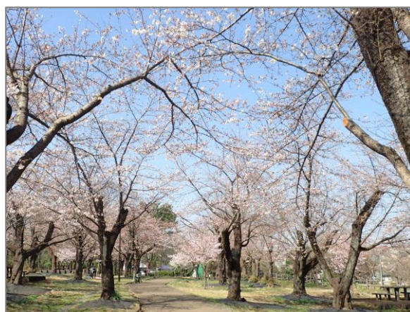
26 緑花による空間づくりと維持管理 （こども自然公園）