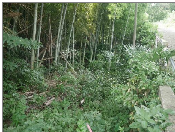
2 森の維持管理 （三溪園緑地）