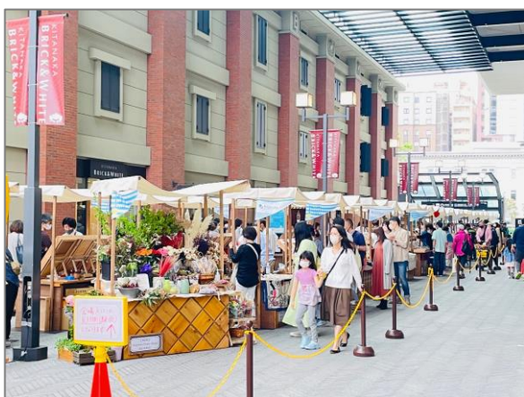
14 青空市・マルシェ等 （横浜北仲マルシェ）