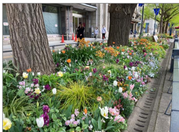
26 緑花による空間づくりと維持管理 （日本大通り）