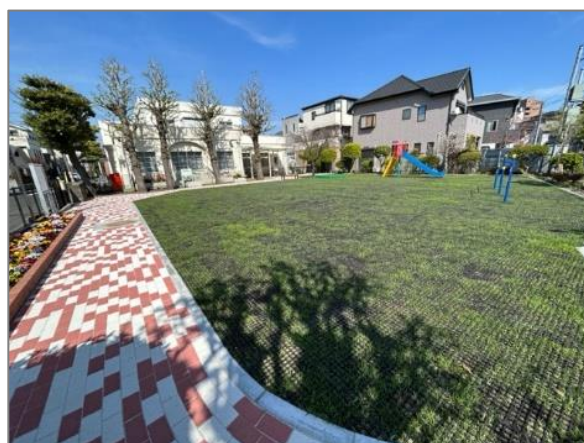
17 公共施設・公有地での緑の創出・育成 （中本牧コミュニティハウス敷地内 こどもの遊び場）