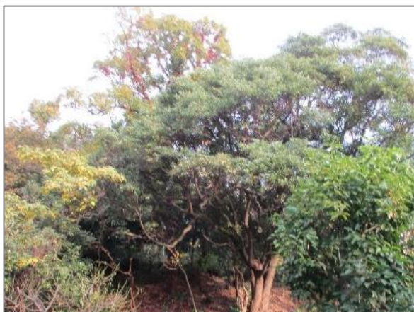
1 緑地保全制度による新規指定 緑地保存地区（池袋）