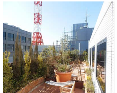
・公開された屋上の緑化