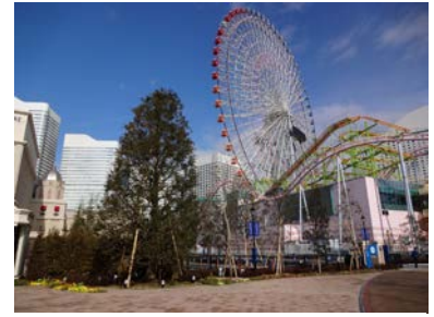
・広場の緑化（地面緑化）