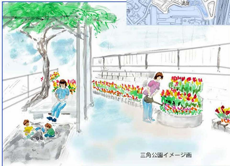
三角公園イメージ画

また、砂場には既存の藤棚で日陰が出来るため、頑丈なベンチ付きプランターを置き、コミュニケーションの場を作る。