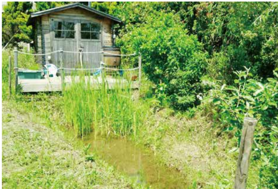
大学でのビオトープ整備