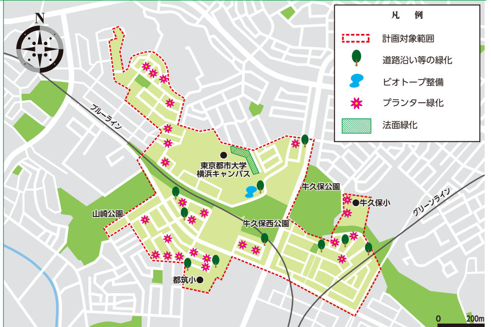
地区の範囲図及び緑化実施場所