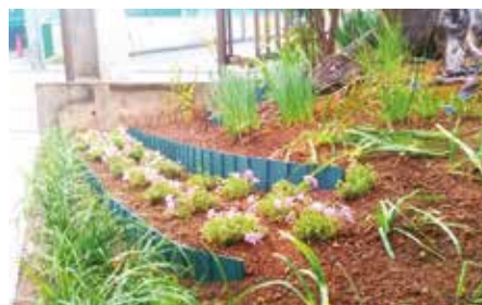
町内会館前庭での緑化