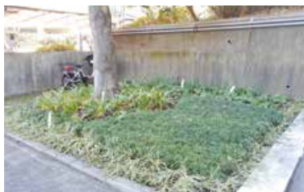
保育園駐車場での緑化