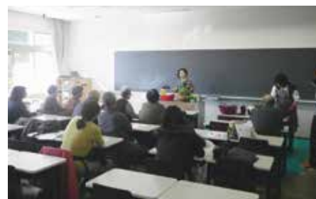
寄せ植え講習会の様子