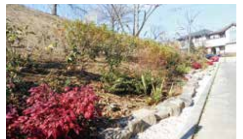
大学北東部での法面緑化