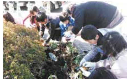
都筑小学校での緑化の様子