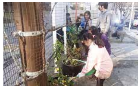
牛久保小学校での緑化の様子