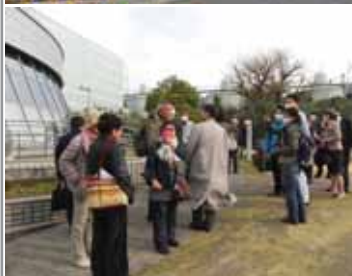
▲ウエルカムゲートからピオトープまでツリーウォッチング

しているのも水はけの良い土づくりが大切なこと。キノコや毛虫なども共生していること。肝腎なことは、都会の木は人のために植えられて体をはっていること。にもかかわらず、花が咲かないと邪魔にされたり、名木でないと大切にされない。そこで、おもしろい木さがして違った価値をつけているなど。街の中で出会った多くの木の写真を提示しての講演でした。