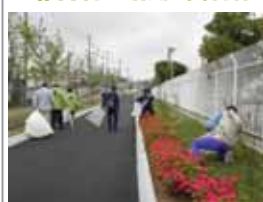
▲日産自動車ゲストホール前 ▼JX 日鉱日石エネルギー前

日産自動車や貨物線の森ファン倶楽部のみなさんと神奈川県から鶴見区にわたる貨物線の森緑道の手入れをしています。鶴見区の大黒町区間では種から苗を育てたり、3月には一般の方も参加して花苗の植付を行いました。