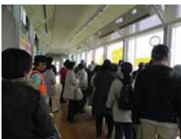
▲東京ガス環境エネルギー館 緑地再整備

アンケートによる緑地等の評価では、参加者の多くがリピーターだったので、京浜地区の「経年変化」を感じとり、現場(エコ・スポット)を採点していました。「評価点」は、施工等の相対評価ではなく、企業担当