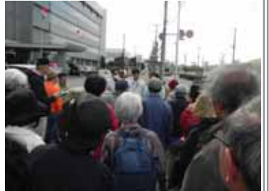
▲日産自動車 沿道緑化

者の説明や対応が丁寧であった現場など、参加者の好印象等が反映されたものになったようです。参加企業からは、「各社が色々な緑化活動に取り組んでおり、自社での活動を検討する一助となった。」、市民からは、「企業姿勢はすばらしい。継続できるように横浜市としても援助すべき！」など、多くの声援が聞かれました。詳しい評価結果は、横浜市みどりアップ推進課から、関係者に報告されています。