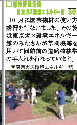
▼東京ガス環境エネルギー館

10月に園芸機材の使い方講習を行ないました。その後は東京ガス環境エネルギー館のみなさんが草刈機等を用いて同館前の道路植栽帯の手入れを行なっています。