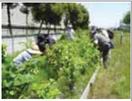
ドングリ苗木植樹地 ▲2012.05