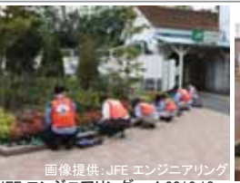
JFE エンジニアリング ▲2012.10 ▼2013.03