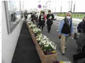
▲JFE エンジニアリング 駅前緑化