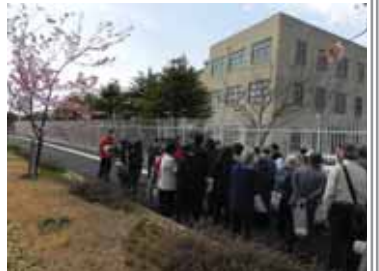
▲貨物線の森緑道 延伸整備