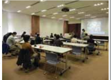
▲会場のキンピール横浜工場