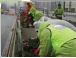
新子安橋 ▲2012.12 ▼2013.03