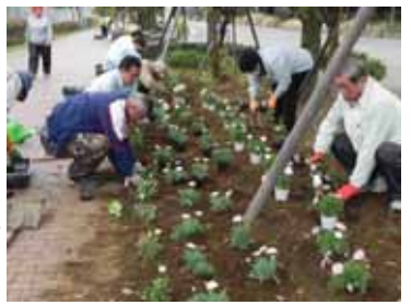
▲東亜合成での沿道植付作業

ン倶楽部、企業のみなさんが、旭硝子沿道のプランターや東亜合成(旧鶴見曹達)の沿道にそれぞれ植え付けました。旭硝子ゼラニウム(混色)計 48 鉢、東亜合成宿根ガーベナ、ガザニア、マーガレット、レンテンローズ、ヘメロカリスの 5 種類計 384 鉢。