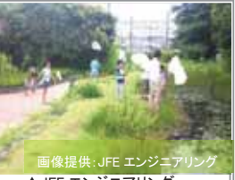
▲JFE エンジニアリング ▼東京ガス環境エネルギー館