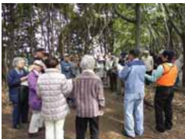
▲JFE エンジニアリング 里山レンジャーズ活動

いる人や地域で暮らす人々によって、愛着を持って大切にされている宝物のような場所を、ツアーガイドと巡りました。現地では関係者から説明を受け、新たに導入された「地域緑のまちづくり事業」等の取り組みを見学し、緑地等の評価を試みました。また、実際に緑道でのごみ拾いを体験し、地域の美化活動の意義を実感しました。