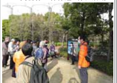
▲キンビール ビオトープ再整備