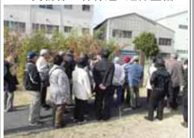
▲貨物線の森緑道 緑化活動

①昭和産業の沿道緑化、②昭和電工の沿道緑化、③新子安橋の花植え活動、④貨物線の森緑道の延伸整備、⑤日産自動車の沿道緑化、⑥貨物線の森ファン倶楽部の緑化活動、⑦キンビールのビオトープ再整備