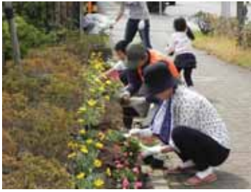
▲JFE トンボみちでの沿道植付作業