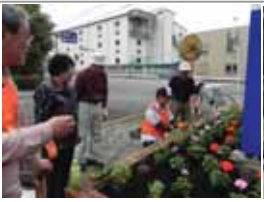
旭硝子 ▲2012.10 ▼2013.03