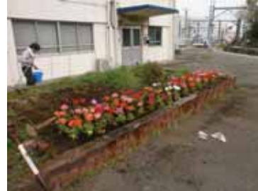
▲JR 浅野駅での植付作業

3月29日(金)、JR 東日本鶴見線営業所の社員のみなさんが、浅野駅構内にゼラニウム(混色) 96 鉢を植え付けました。