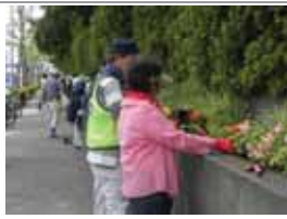
昭和電工前沿道植栽 ▲2012.09