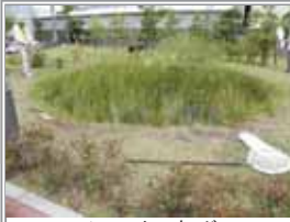
▲JVC ケンウッド ▼キリンビール

8月、京浜地区を中心に11ヶ所で企業、市民、行政のみなさんの参加によりトンボ本調査が行なわれました。JFE トンボみち、東京ガス環境エネルギー館、麒麟横浜ビアビレッジでは子どもたちによる「トンボ捕り大作戦」も行なわれました。