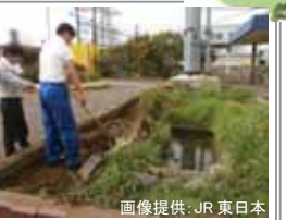
JR 東日本 ▲▼JR 浅野駅 2013.03