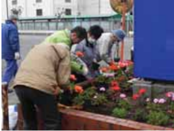
▲旭硝子看板での植付作業

ン倶楽部、企業のみなさんが、旭硝子沿道のプランターや東亜合成(旧鶴見曹達)の沿道にそれぞれ植え付けました。旭硝子ゼラニウム(混色)計 48 鉢、東亜合成宿根ガーベナ、ガザニア、マーガレット、レンテンローズ、ヘメロカリスの 5 種類計 384 鉢。