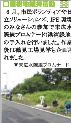
▼末広水際線プロムナード

6月、市民ボランティアや日立ソリューションズ、JFE 環境のみなさんの参加で末広水際線プロムナード(港湾緑地)の手入れを行いました。作業後は鶴見工場見学も企画されました。