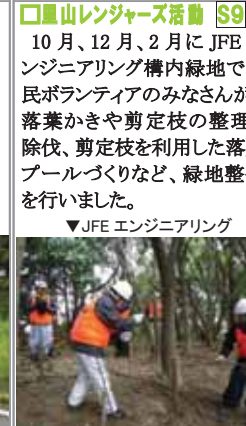
▼JFE エンジニアリング

10月、12月、2月に、JFE エンジニアリング構内緑地で市民ボランティアのみなさんが、落葉かきや剪定枝の整理、除伐、剪定枝を利用した落葉ブルーづくりなど、緑地整備を行いました。