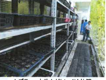
▲ズラッと並んだトレイは壮観