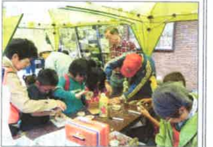
▲昨年のクラフト作り(上下)

日時: 10月18日(土) 9時30分～15時30分 小雨決行 荒天その他の事由による中止の場合、19日(日)に順延 会場: 入船公園(鶴見区弁天町3-1) JR鶴見線「浅野駅」より徒歩1分 鶴見駅東口から市営バス15、27系統 「入船橋バス停」より徒歩3分