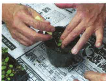
▲セル苗をフォークで Pot 上げ

9月11日(木)、今年度の「かながわ花づくり分科会(主催:神奈川県土木事務所)」の初作業が神奈川県土木事務所で行なわれました。この活動は平成23年に愛護会同士の交流を目的として「パンジー・ビオラの花苗づくり」を行なったのが最初。4年目となる今年の参加愛護会は20団体、30名。育苗目標はパンジー400苗、ビオラ1300苗、計1700苗。今年から、より専門性を持った「分科会」として活動を展開しています。初作業のこの日は、まず公園コーディネーターの方から11月中旬迄の活動スケジュールや、当日の「Pot上げ」作業についての説明がありました。指先程のセル苗