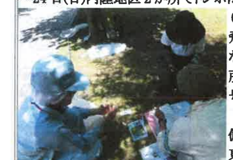
▲8月7日 本調査 キリンビール

今回、新たに水辺が整備された調査場所は、東芝新芝浦駅前、北部第二水再生センター、貨物線の森緑道予定地の3か所。全調査場所11か所の延べ調査員数は約200人、捕獲数は11種680頭、再捕獲116頭、調査場所間の移動個体は1頭確認されました。これは7日にキリンビールでマーキン