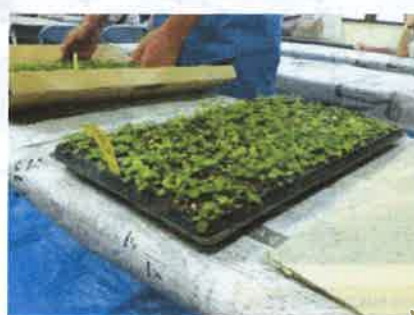
▲セルトレイにピシッリ並んだセル苗