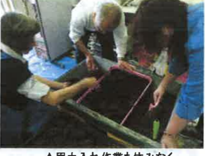
▲用土入れ作業も休みなく