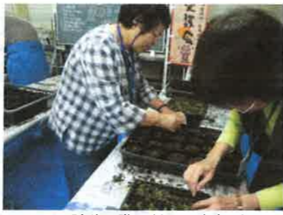
▲随分手際よくなってきました

を一苗ずつフォークですくい、Potに上げていきます。ポイントは“ゆっくり・やさしく・確実に!”参加者はフォークを使っての細かい作業に戸惑いながらも次第にスピードアップ。Potへの用土入れ作業も大忙し。アツという間に準備された苗のPot上げが完了。その後は殺虫剤を撒き、水やりをして、屋外のラックにセット。スチールラックを壁面に並べて育苗棚として利用する方法は「神奈川県方式」。同事務所のオリジナルです。約2ヶ月の活動期間中には、今回のPot上げの他に、水やり、施肥、植付け講習会等が予定され、日誌を付けて養生苗の記録も取ります。《初参加した方の感想》「このような小さな苗を扱うのは初めてで驚きました。活動回数は少なくないが花苗が育っていくのが楽しみです。」