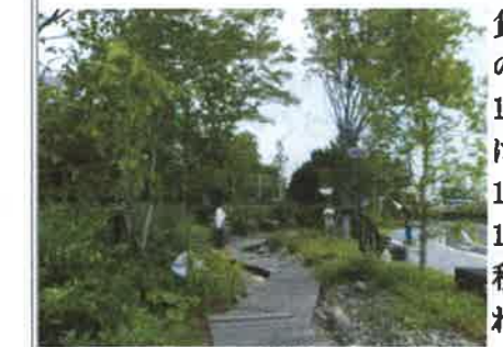
▲8月8日 本調査 東芝

グしたシオカラトンボが、19日に三ツ池公園で再捕獲されたもので、翌日も同一個体が三ツ池公園で再捕獲されています。8月16日(土)には入船公園でトンボ捕り大作戦が実施されました。参加した子どもたちは20人。トンボの捕獲は35頭、再捕獲は4頭でした。トンボ捕りの後は表彰式と田口先生の講評。調査結果は本調査として活用されています。