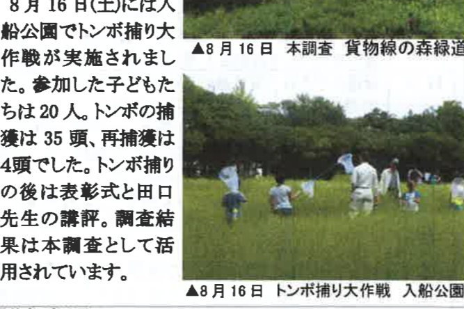
▲8月16日 本調査 貨物線の森緑道

グしたシオカラトンボが、19日に三ツ池公園で再捕獲されたもので、翌日も同一個体が三ツ池公園で再捕獲されています。8月16日(土)には入船公園でトンボ捕り大作戦が実施されました。参加した子どもたちは20人。トンボの捕獲は35頭、再捕獲は4頭でした。トンボ捕りの後は表彰式と田口先生の講評。調査結果は本調査として活用されています。