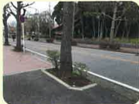
桂山公園脇(平成30年3月)