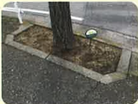
富士見通り(平成30年3月)