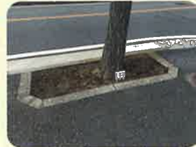
桂台通り(平成30年3月)