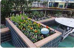
大型メッシュプランターによる花壇風景