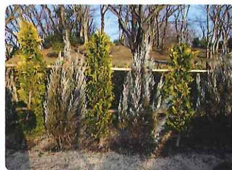
(駐車場周りの緑化)