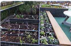
大型メッシュプランターによる花壇風景