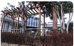
富士見通りから見たパーゴラ