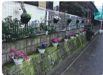
(フェンス沿いの緑化)