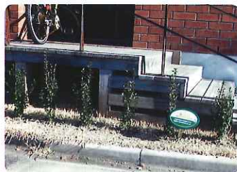
(沿道に面した植栽による緑化)