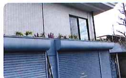
駐車場の屋上緑化

訪問の家 朋の中庭に「花と緑の拠りどころ」を創出することを狙いとして緑化整備を実施しました。～すなわち街のセンターゾーンの中心にある朋の中庭に地域の人々が自然に集まり、花と緑を楽しみ、交流が生まれるような「ウェルカムガーデン」を創出することが狙い～ —朋の入り口に案内板を設け、中庭に出入り出来るようにします—