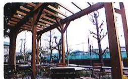
パーゴラ・ぶどう棚のある風景