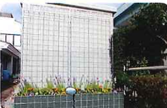
入り口正面のメッシュプランター