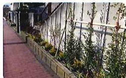
富士見通り沿いの沿道緑化