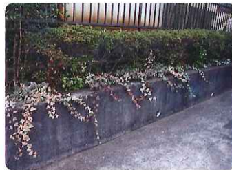
(駐車場周りの緑化)