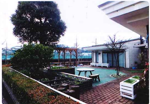
ウェルカムガーデン全景