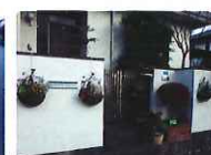
(ハンギングバスケット)