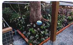
シンボルツリーの周りの彩り