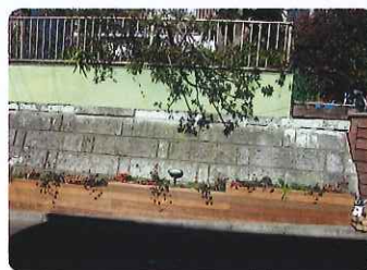
(沿道に面する擁壁の緑化)