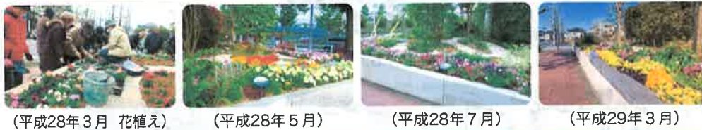
(平成28年3月 花植え) (平成28年5月) (平成28年7月) (平成29年3月)

2 桂台地域ケアプラザ 富士見通りを歩く人が花や緑による潤いを感じられ、かつオープンガーデンとして誰もが入れられる花壇を整備した。また施設の顔であり、来所者の憩いの場となるエントランス部にふさわしい彩りを演出するためメッシュプランターを設置した。平成28年3月に完成。花壇のバラのアーチは8月に完成。尚、平成29年3月末までに花壇を門のところまで延長し、エントランス部のメッシュプランターも増やす予定である。