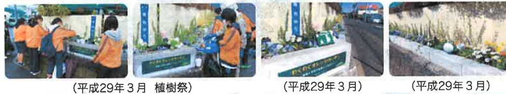
(平成29年3月 植樹祭) (平成29年3月) (平成29年3月)

3 桂台中学校 学校外周は広域であり、すべて道路に面しているので、道行く人が歩きながら花や緑を楽しめる空間を創出することを考え、整備した。まず通行量も多くアイストップとなる南東角地に花壇を整備した。この花壇は桂台中学校の環境委員会の生徒とともに3回に亘って打ち合わせを行い設計した。また生徒によるアイデア募集の結果「わくわくオレンジガーデン」と命名された。外周全域にわたってどのような緑化をするかは今後の検討事項。