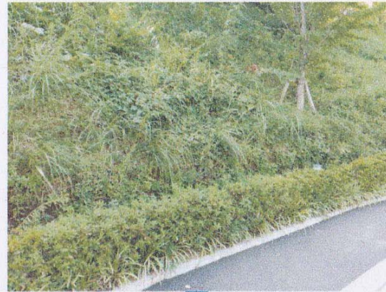
B棟法面(花の滝ストリート)