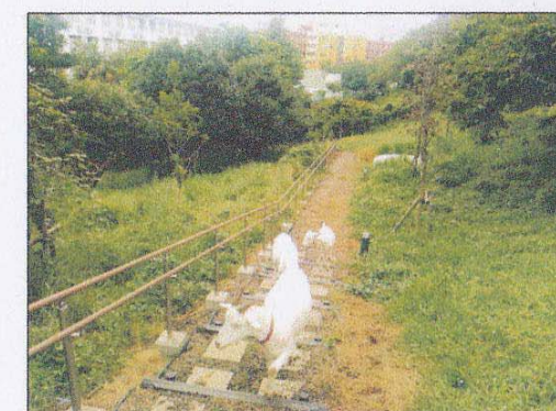
E棟法面(ファミリーガーデン)