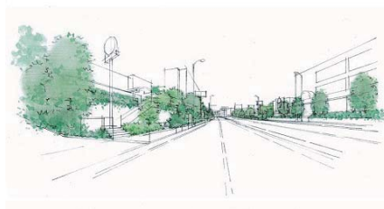
○一体感のある緑化完成イメージ