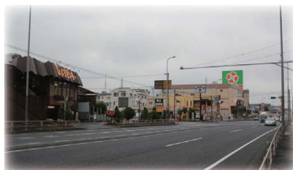
○店舗と事業所が立ち並ぶ北寺尾交差点