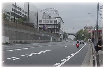
○街路樹のない国道1号の沿道