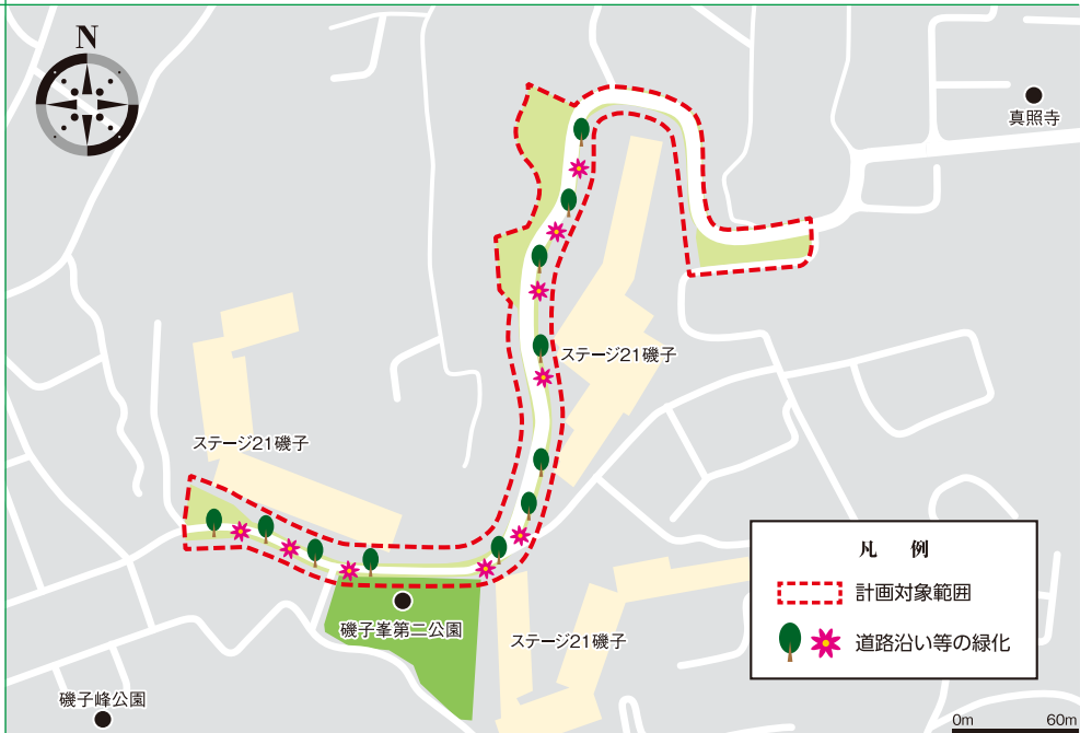
地区の範囲図及び緑化実施場所