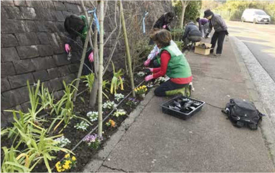
植え付けイベント