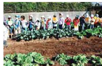
里山学習 東本郷小学校生徒里山学習中