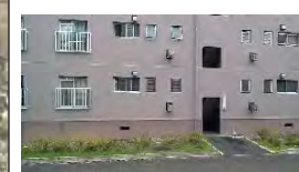
栽培展示予定 (集合住宅前)