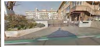
栽培展示予定 (小学校)