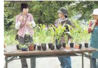
ガーデニング お花の交換会 毎年 5 月実施中