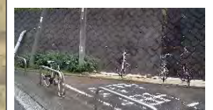
栽培展示予定 (街路)