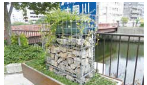
大岡川沿いでの緑化

大岡川に面した公共空間のほか、京急線の高架下の民有地にも面的な広がり意識して、来街者に地域の魅力を伝え、日常的な賑わいの創出に寄与できるように、地面や壁面に緑化を推進していきます。