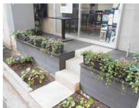
高架下施設での緑化