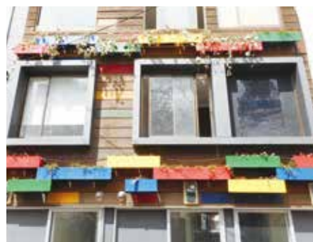
大岡川沿いでの壁面緑化