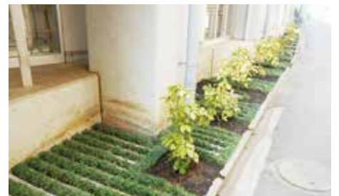
高架下施設での緑化