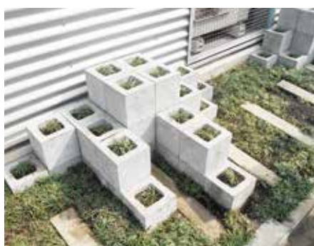
高架下施設での様子