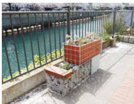
大岡川沿いでの緑化

スコップや移植ごてなどの園芸用資材や肥料など、維持管理活動に必要な備品を購入しました。