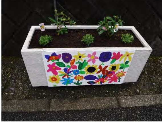
洋四小 令和2年度1年生による絵プレート