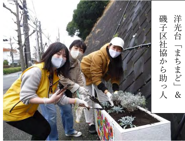
洋光台「まちまど」& 磯子区社協から助っ人