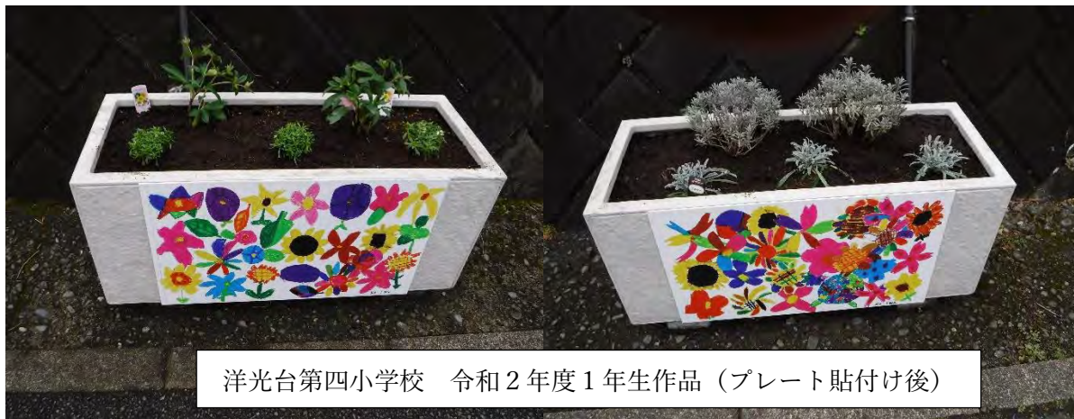
洋光台第四小学校 令和2年度1年生作品（プレート貼付け後）