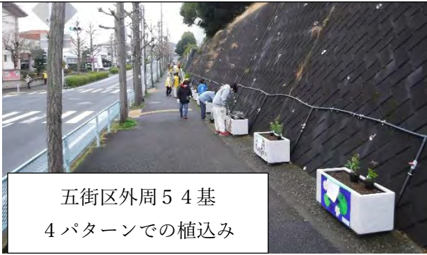
五街区外周54基 4パターンでの植込み