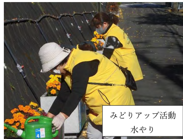
みどりアップ活動 水やり