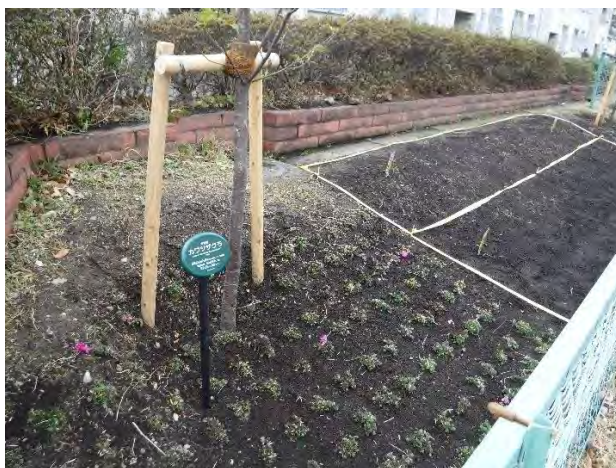
集会所通り法面植栽整備 45m 河津さくら8本 芝桜2000株 菜の花・ひまわり 播種