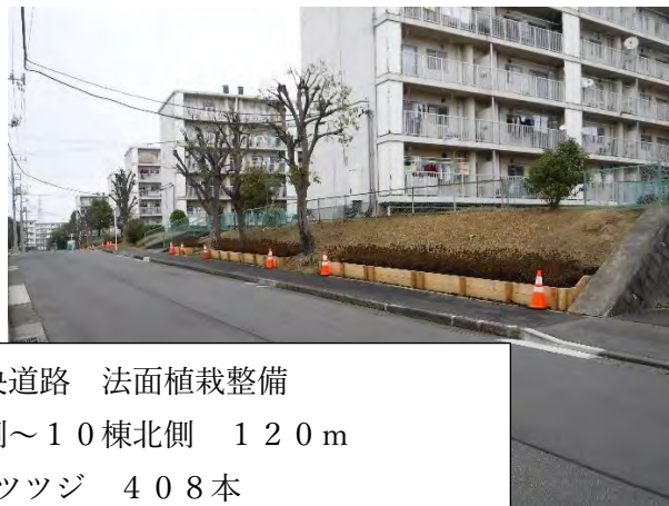
中央道路 法面植栽整備 2棟南側～10棟北側 120m ツツジ 408本