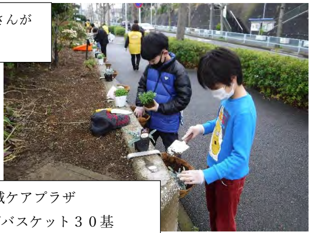
地域ケアプラザ ハンギングバスケット30基 (イベリス・ガザニア) 玄関脇プランター4基 (クリスマスローズ・イベリス)