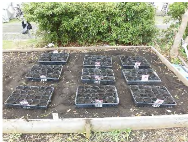
整備した苗床 小分けして播種してみました