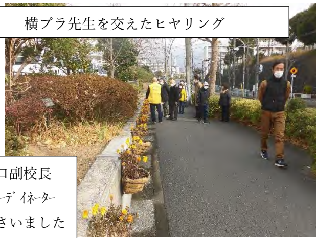
洋四小 山口副校長 ケアプラ森コーディネーター も参加して下さいました