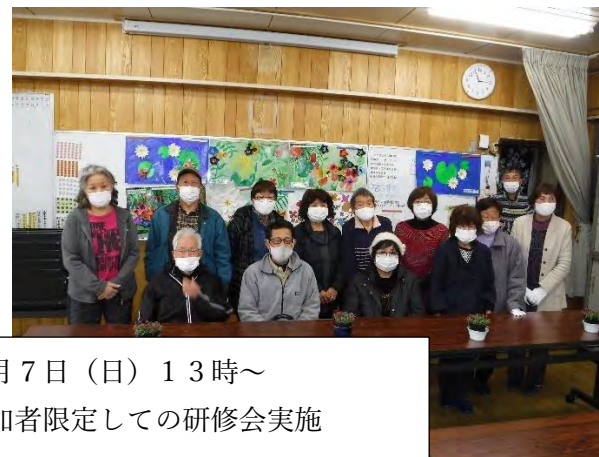
令和3年3月7日(日) 13時～ コロナ対策で参加者限定しての研修会実施