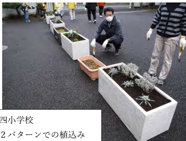
洋光台第四小学校 大型プランター8基 2パターンでの植込み 校長・副校長も参加して下さいました。