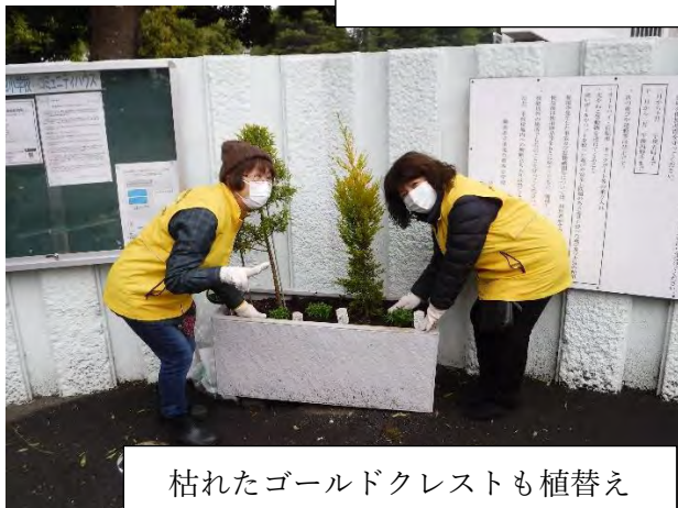
枯れたゴールドクレストも植替え