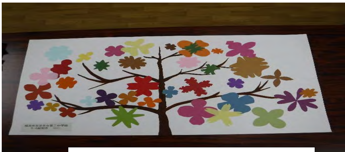
洋光台第2中学校 5組・6組生徒&美術部作品の一部（原画）