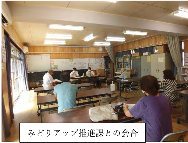
みどりアップ推進課との会合