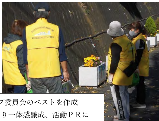
みどりアップ委員会のベストを作成 活動時着用により一体感醸成、活動PRに