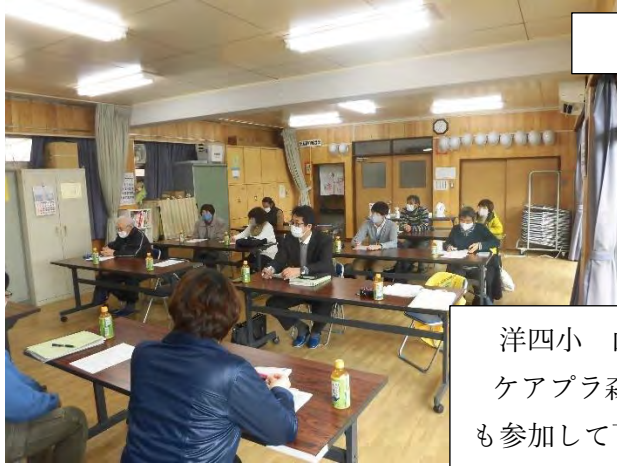
横プラ先生を交えたヒヤリング