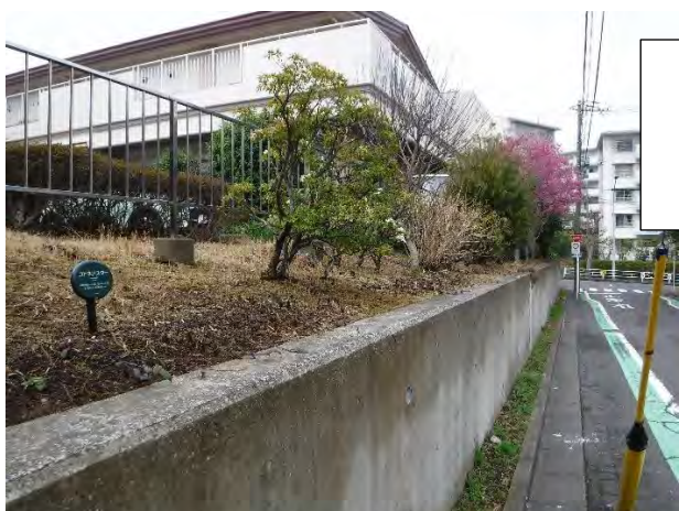
地域ケアプラザ 東側擁壁上部 植栽整備 トネアスター120株