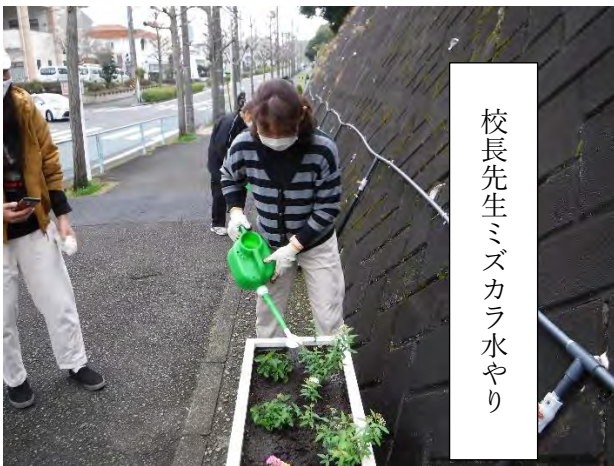
校長先生ミズカラ水やり