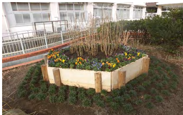
洋四小 八の字池 中島花壇整備 アジサイ10株 ビオラ90株タマリユウ180株