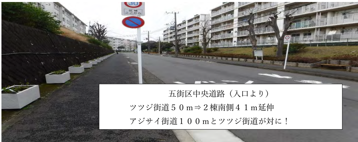
五街区中央道路（入口より） ツツジ街道50m⇒2棟南側41m延伸 アジサイ街道100mとツツジ街道が対に！