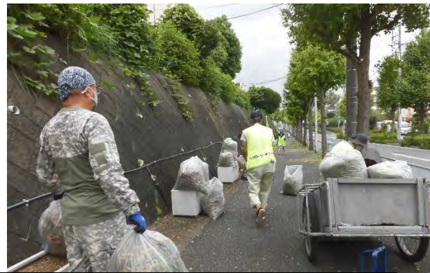
みどりアップ推進エリアの清掃も大切！ ハマロードサポート活動も行い、美化・緑化など「まちづくり」を自分達で行う啓発に