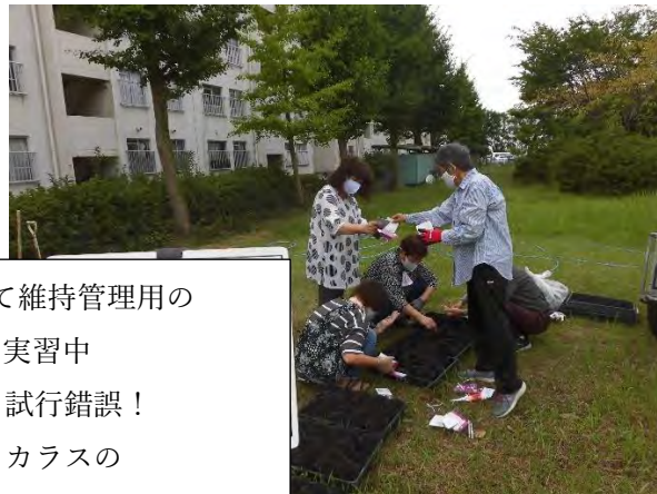
3年経過後を見据えて維持管理用の 花苗を育てる実習中 土壌整備、種植えと試行錯誤！ 発芽しましたが残念ながらカラスの 栄養源になってしまいました