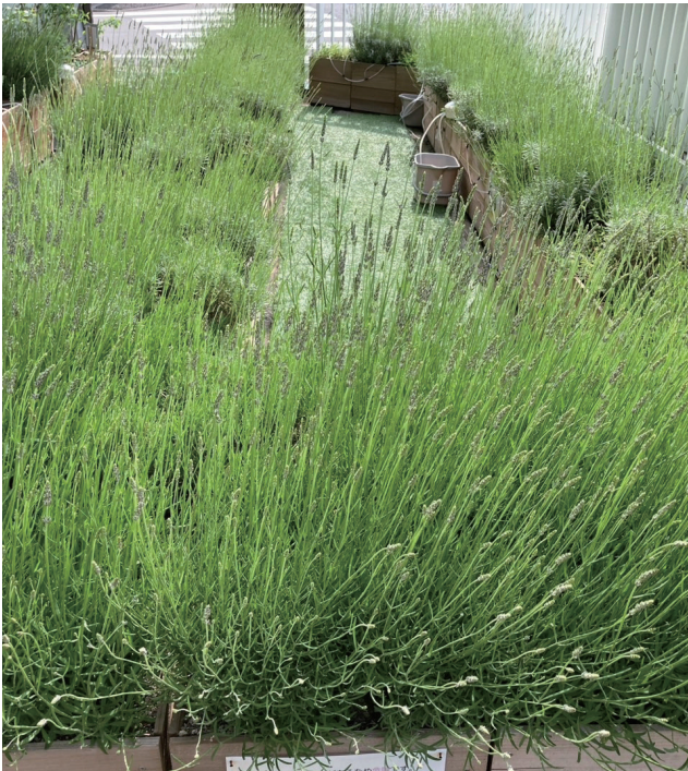
① コンテナ花壇のラベンダー