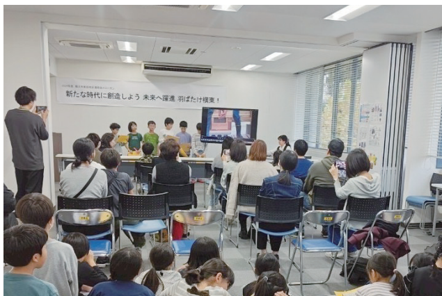
ハチ育の取組風景