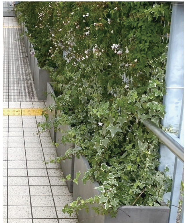
② 郵便局スロープの緑化