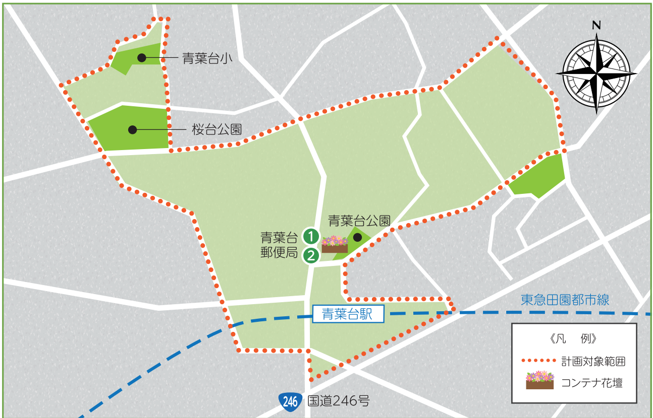
計画の実施箇所図