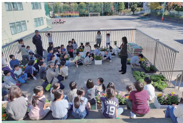
青葉台小学校ワークショップ