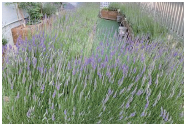
満開のラベンダー