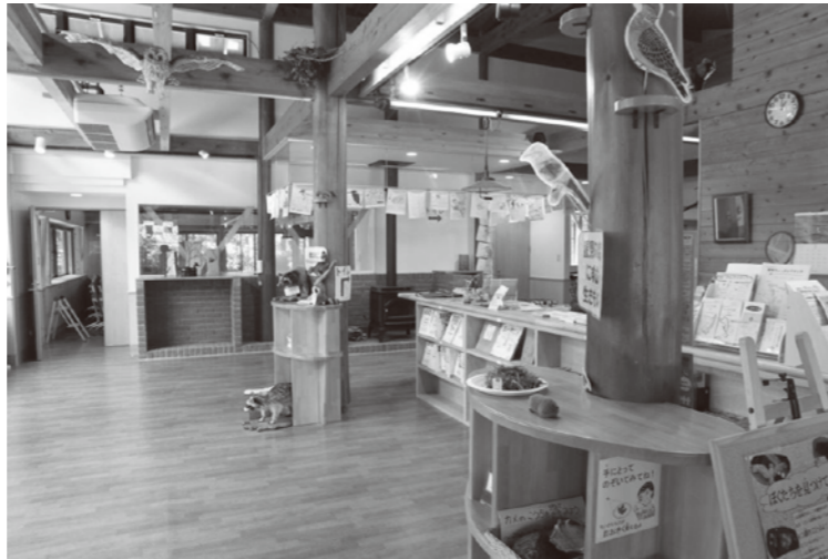
リニューアルした館内の様子

今後は緑区新治町のにはる里山交流センター他についてもウェルカムセンターとして位置づけ、展示の整備等を進めていきます。