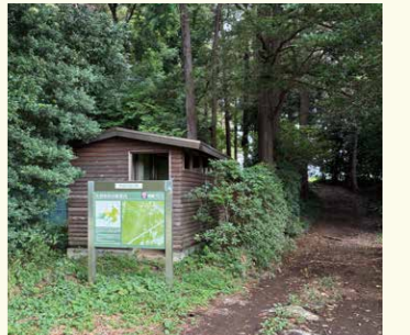
2 矢指市民の森トイレ前