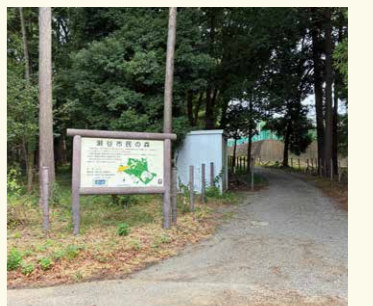
8 瀬谷市民の森入口