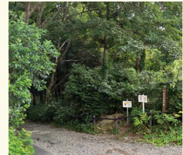
1 追分市民の森入口