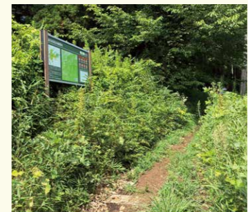
3 八ツ塚みち案内前