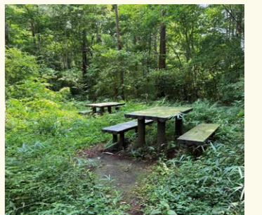
4 八ツ塚みちベンチ前