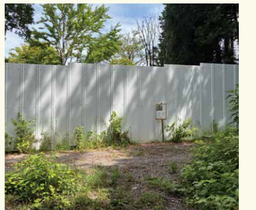
6 GREEN×EXPO2027会場隣接スポット