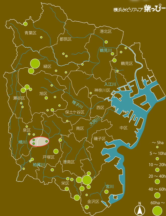
市民の森、ふれあいの樹林の場所・面積