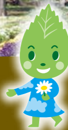
横浜みどりアップ 葉っぱー