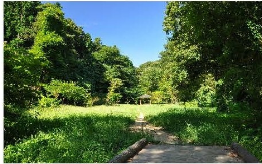
氷取沢市民の森(おおやと広場)

「市民の森」は山林所有者の方々の御好意により山林を使用させていただいているものです。散策道や広場の清掃・草刈り等は地元の方々でつくられた「市民の森愛護会」が行っています。また、保全活動に積極的に関わりたいという方々による森づくりボランティア団体活動の場にもなっています。