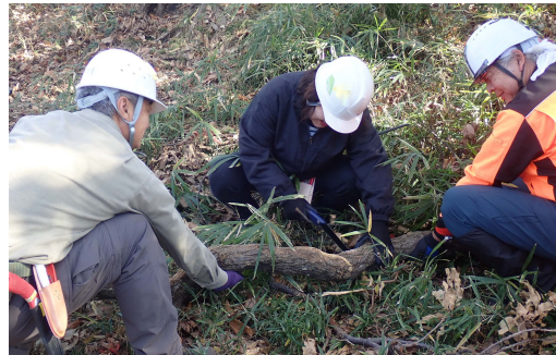
ボランティア活動風景

市民の森は自然とのふれあいの場として、季節の移り変わりを楽しみながら散策することができます。「峯市民の森」はかつて良く効くお灸の里山として名声があり、いまでも数軒の灸院から紫煙がのぼる