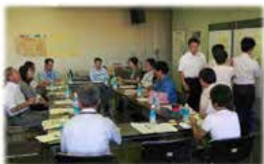
地域緑化計画の検討の様様

新たな事業所におかれましても、既存の地域緑化計画の方針へのご理解ご協力をお願いします。地域緑化計画にご賛同いただける事業所におかれては、地区の緑のまちづくり協議会の取組にご協力ください。