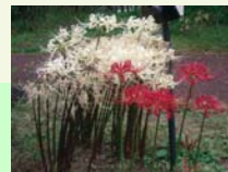
ヒガンバナ (リコリス類)

紅葉 (イチョウ・モミジ類・ドウダンツツジ等) ヒガンバナ、ホトトギス類、ツワブキ、シュウメイギク ヒヨドリジョウゴ、カラスウリ