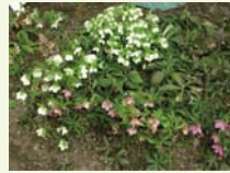
クリスマスローズ