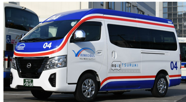
▲運行車両(日産 キャラバン)