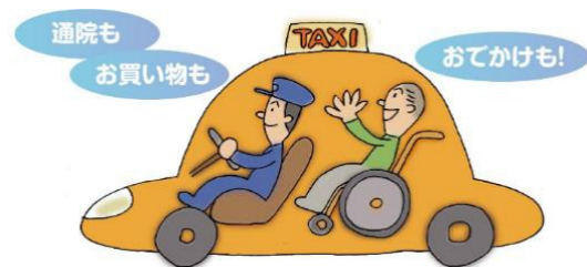
車いすユーザーは(2/10、23)両会場

車両は、トヨタ・ジャパントクシー、ニッサン・セレナ e-パワー、軽自動車型の福祉車両を予定しています。