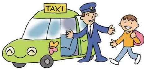
知的障がいのある方は(2/10)鶴見会場

ぜひ、みなさんも体験してください。 使いやすいタクシー・外出支援を実現したいですね。