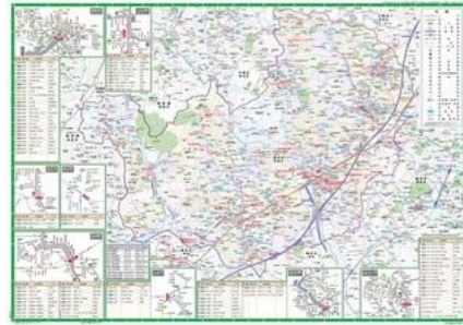
青葉区ガイドマップ地図面

PDF形式のファイルを開くには、別途PDFリーダーが必要な場合があります。 お持ちでない方は、Adobe社から無償でダウンロードできます。