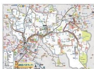
栄区バスマップ地図面