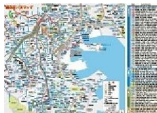
磯子区バスマップ地図面