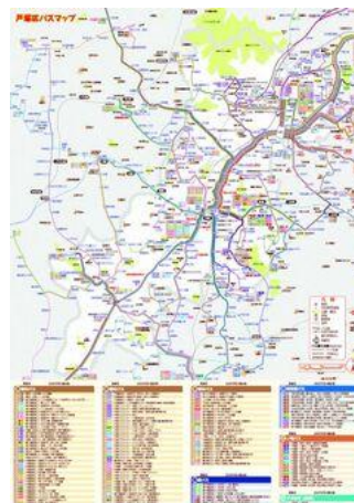
戸塚区バスマップ地図面