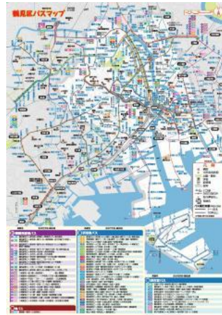
鶴見区バスマップ地図面