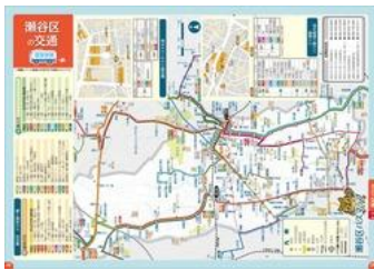
瀬谷区バスマップ