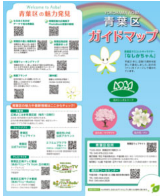
青葉区ガイドマップ情報面