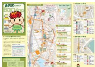
金沢区バスマップ情報面