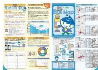
泉区バスマップ情報面

泉区の転入者の皆さまに配布される「 泉区生活便利帳 」の冊子中綴じ見開きページに泉区バスマップが掲載されています。