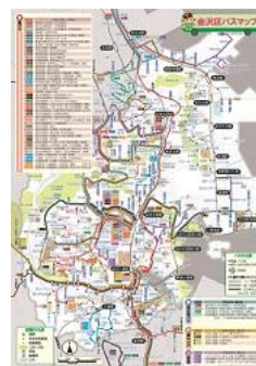
金沢区バスマップ地図面