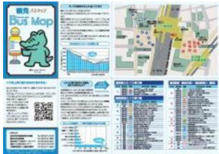
鶴見区バスマップ情報面