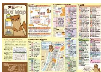
栄区バスマップ情報面