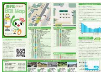
磯子区バスマップ情報面