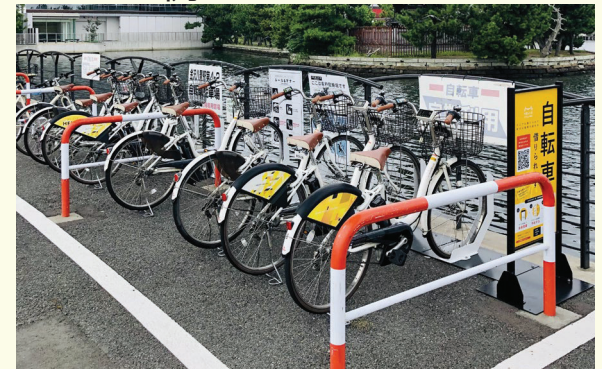
金沢八景駅第四自転車駐車場→