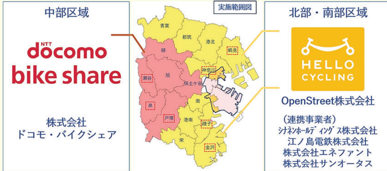
重点展開区 横浜都心部区域 (対象外)

横浜都心部区域（バイバイク実施エリア）を除く市内を3つの区域（うち7区は重点展開区として先行的に事業展開）に分け、下図の体制で事業を実施