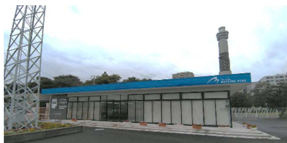
バス待合室（山下ふ頭）