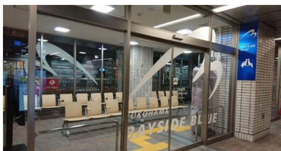
バス待合室（横浜駅東口）