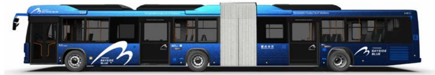
車両・停留所等に共通のシンボルマークを使用します。