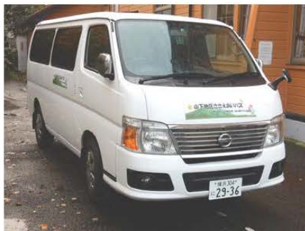
<実証運行に用いる車両>