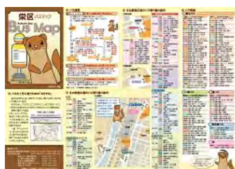
栄区バスマップ情報面