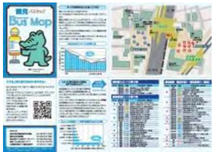
鶴見区バスマップ情報面