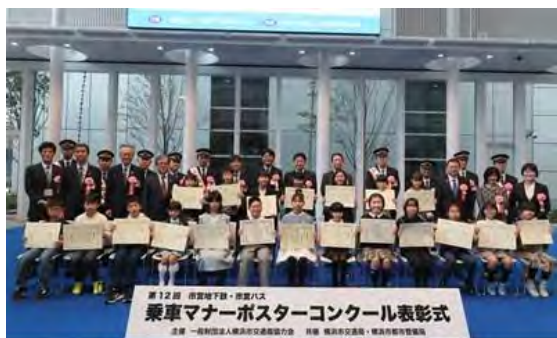
令和5年11月18日 於 横浜市役所 アトリウム

入賞者に対する表彰式を、11月18日(土曜日)に横浜市庁舎1階アトリウムにて実施しました。