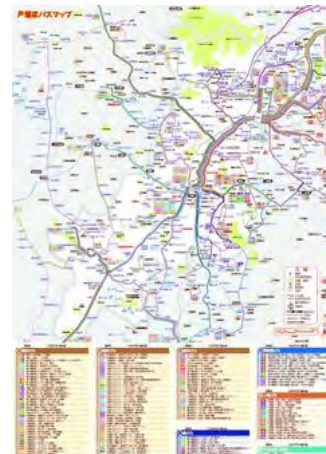
戸塚区バスマップ地図面