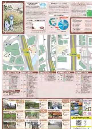
戸塚区バスマップ情報面