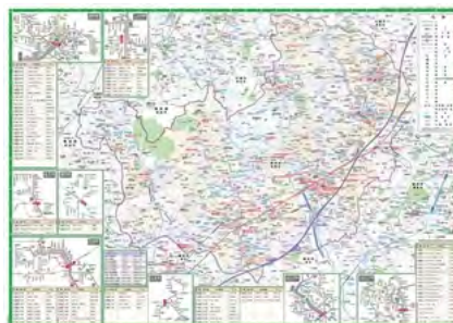
青葉区ガイドマップ地図面