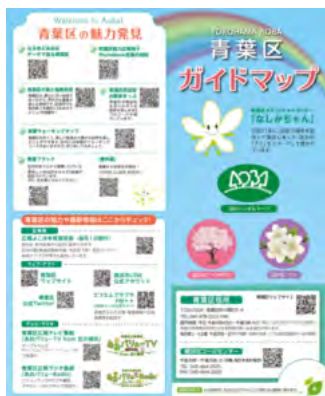
青葉区ガイドマップ情報面