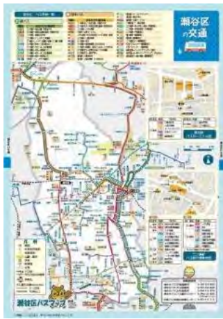
瀬谷区バスマップ