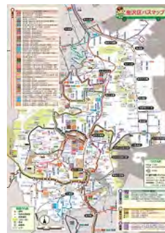
金沢区バスマップ地図面