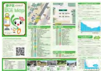
磯子区バスマップ情報面