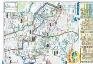
泉区バスマップ地図面