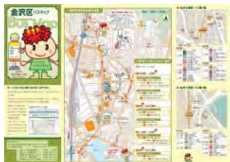
金沢区バスマップ情報面