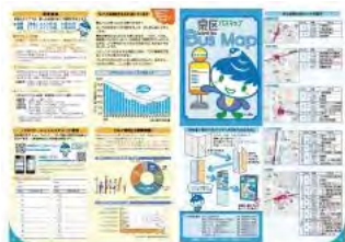
泉区バスマップ情報面

泉区の転入者の皆さまに配布される「 泉区生活便利帳 」の冊子中綴じ見開きページに泉区バスマップが掲載されています。