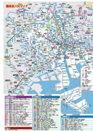
鶴見区バスマップ地図面