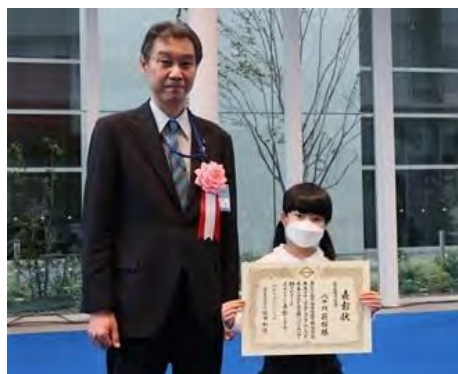
都市整備局長賞授与