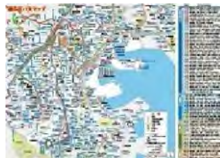
磯子区バスマップ地図面