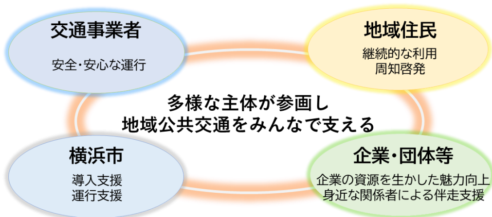
図8-1 連携体制イメージ

本市の目指す姿の実現に向けた取組を着実に推進するため、地域住民、交通事業者、横浜市といった関係者が、それぞれの役割のもと連携して地域公共交通を支えています（図8-1）。さらに、様々なノウハウ、知見、技術を有する企業や地域に身近な団体等の参画を促し、その実現性、持続性を高めていきます。