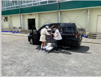
UDタクシー乗降体験 (相沢小学校)

体験授業では、バス事業者やタクシー事業者が講師となり、それぞれノンステップバスやUDタクシーの車両の特徴を見てもらいながら、車いすでの車両乗降・車いすの固定の方法について説明を行いました。