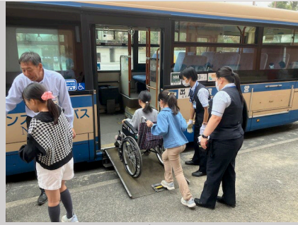
ノンステップバス乗降体験 (茅ヶ崎小学校)