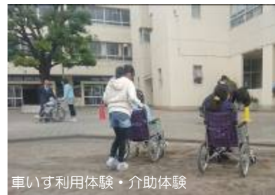
車いす利用体験・介助体験