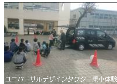
ユニバーサルデザインタクシー乗車体験