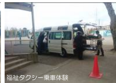
福祉タクシー乗車体験