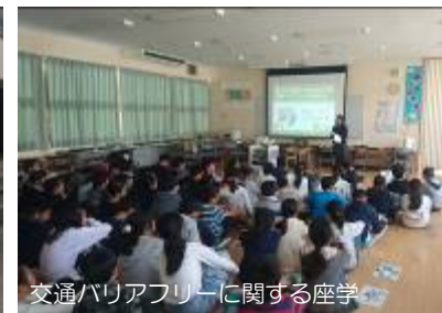
交通バリアフリーに関する座学