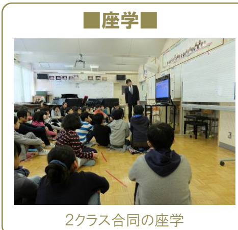
2クラス合同の座学

テーマ みんなで考える 地球にやさしく ヒトにも便利な かしこい移動のしかた 目的 地球温暖化のしくみや、交通手段の選択と温室効果ガスの関係を学ぶとともに、クルマを使う人の立場になって、移動の仕方を考える。 実施日 平成29年2月8日(水) 9:00~9:10 座学 9:10~9:50 ワーキング 9:50~10:00 まとめ・発表 対象者 大道小学校6年生(2クラス)