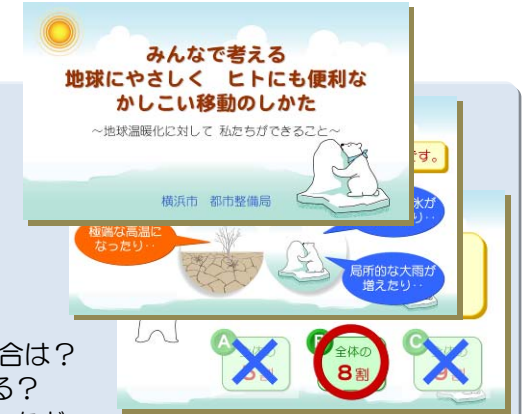
▲座学用パワーポイント