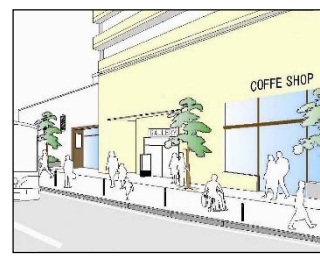
※隔地駐車場により解消