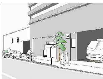
※駐車場の入口で歩道が分断