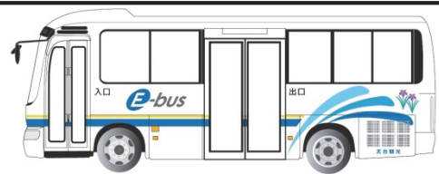
図 4/1からの車両イメージ （白い車体に青と黄色の線が入ります。）