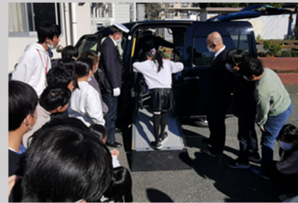
UD タクシー乗降体験 (釜利谷東小学校)

体験授業では、バス事業者やタクシー事業者が講師となり、それぞれノンステップバスやUDタクシーの車両の特徴を示しながら、車いすでの乗降方法や車いすの固定の方法について説明を行いました。