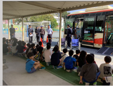
ノンステップバス乗降体験 (日吉南小学校)