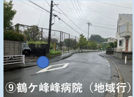
⑨鶴ヶ峰病院（地域行）