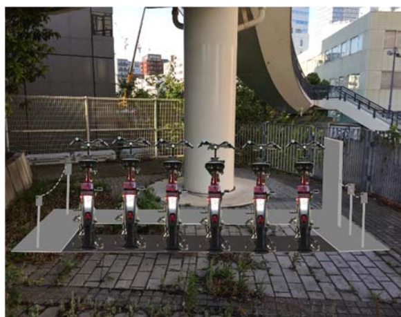
ふれあい歩道橋下