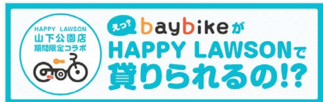
HAPPYLAWSON 山下公園店連携企画

※『30 分くりかえし使えるパス (30 くりパス)』は、baybike 運営事務所でも販売します。