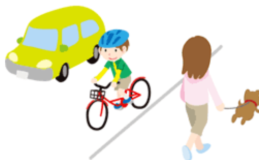
「自転車は車道の左側走行」

→ コミュニティサイクルを利用すると、駐輪場を借りる手間が省けます。 交通ルールを守って安全・快適に自転車をご利用ください。