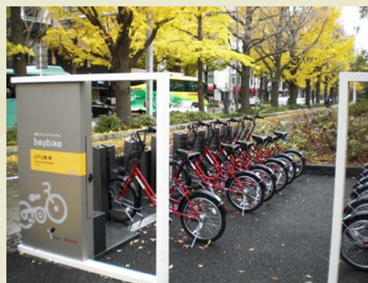
ポート No.9 山下公園・東

みなとみらい地区や山下地区を中心とした横浜都心部の観光には、自転車の利用がお勧めです！特にこの時期、日本大通りや山下公園通り等では、イチョウ並木が見ごろを迎え、ライトアップなども実施されます。長期社会実験の結果では、9月～11月の利用が最も多く、「秋」の自転車利用が大人気です。横浜都心部にお越しの際は、baybike を利用して観光スポットを効率よく、そして快適に移動してみたいはいかがでしょうか。