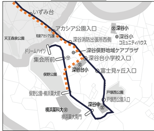
— 上飯田車庫～下飯田駅前～ドリームハイツ --- 下飯田駅前～俣野公園・横浜薬大前(新設)

下飯田方面路線については、増便することとしておりますが、下表が、 増便後の下飯田駅、俣野公園・横浜薬大前の、平日の時刻表案 となります。