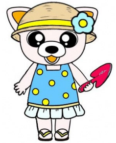
横浜市交通安全キャラクター ルールちゃん