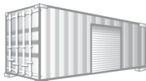
コンテナ（倉庫・店舗の用途）