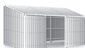
単管パイプ組による屋根掛け