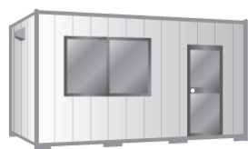
プレハブ・ユニットハウス