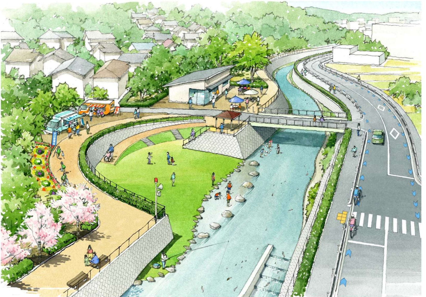
横浜市が目指す WELL-BEING な川づくりのイメージ図