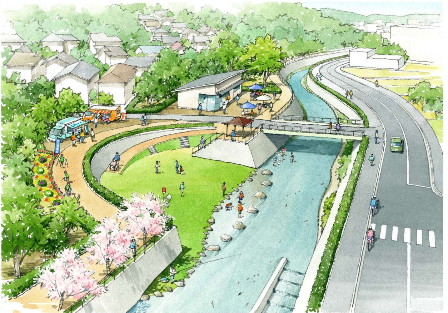
横浜市が目指す WELL-BEING な川づくりのイメージ図